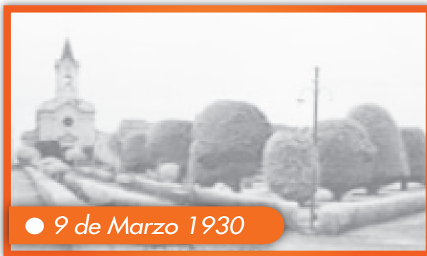
● 9 de Marzo 1930

Se funda la Escuela "La Milagrosa" de Punta Arenas.