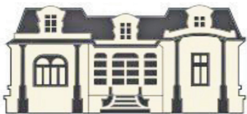
Museo Regional de Magallanes