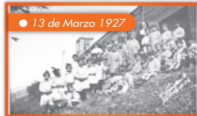
● 13 de Marzo 1927

Inauguración Templo Parroquial de Puerto Natales.