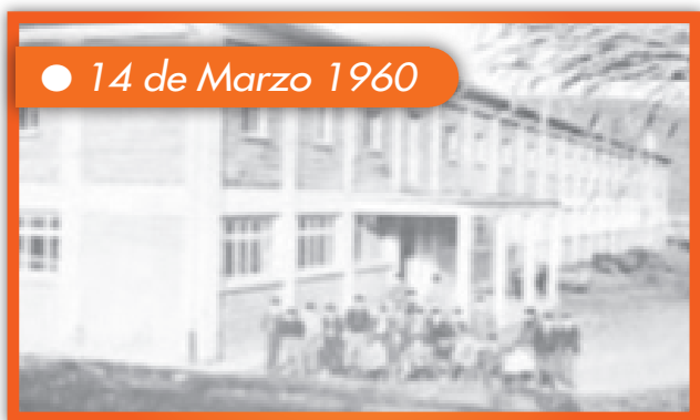
● 14 de Marzo 1960

Se inaugura el Hogar del Niño Miraflores.