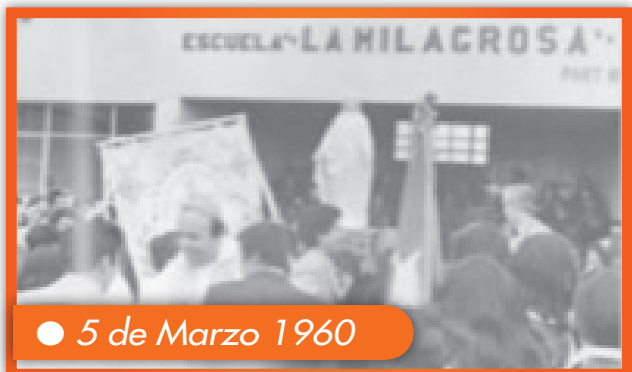
● 5 de Marzo 1960

Se funda la Escuela "La Milagrosa" de Punta Arenas.