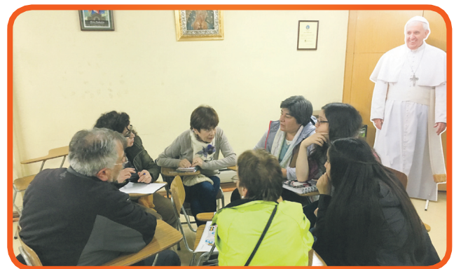
Inicio del Proceso de Discernimiento en la Parroquia Catedral y en el Consejo de Personal Apostólico