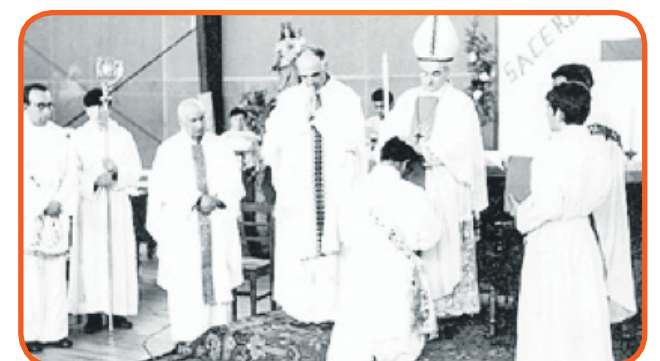
SU ORDENACIÓN SACERDOTAL, ACTO PRESIDIDO POR EL OBISPO VLADIMIRO BORIC, EN 1971, EN PORVENIR.

Saludo a los porvenireños; los llevo en el corazón, amo mucho a ese pueblo porque ahí trabajé muchos años de mi existencia. A los jóvenes les digo que son una fuerza muy grande en el mundo, que se formen bien, que amen a su patria, que sean personas cultas y que busquen siempre el bien de los demás, el bien de la nación, la alegría de sus familias y que aporten con su formación al engrandecimiento de Chile”.