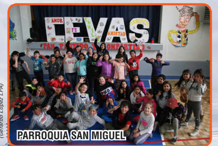
PARROQUIA SAN MIGUEL