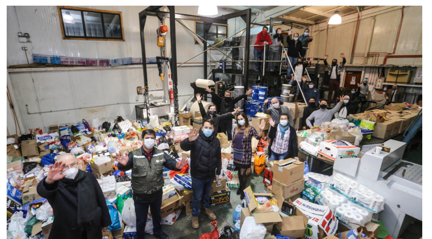
EN EL CIERRE DE LAS 38 HORAS, CON CADA UNO DE LOS INTEGRANTES DE PINGÜINO MULTIMEDIA.