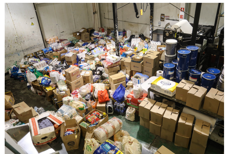
PARTE DE LAS 25 TONELADAS DE AMOR Y CARIÑO QUE CADA UNO DE LOS MAGALLANOS HICIERON POSIBLE Y QUE BENEFICIARÁ A CAVIRATA, CARITAS Y HOGAR DE CRISTO.