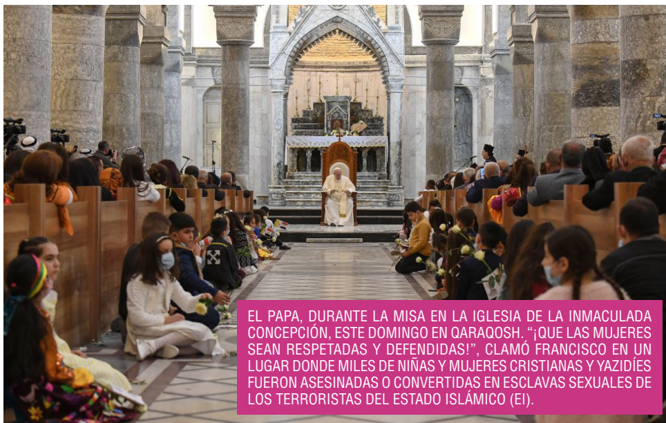
EL PAPA, DURANTE LA MISA EN LA IGLESIA DE LA INMACULADA CONCEPCIÓN, ESTE DOMINGO EN QARAQOSH. "¡QUE LAS MUJERES SEAN RESPETADAS Y DEFENDIDAS!", CLAMÓ FRANCISCO EN UN LUGAR DONDE MILES DE NIÑAS Y MUJERES CRISTIANAS Y YAZIDÍES FUERON ASESINADAS O CONVERTIDAS EN ESCLAVAS SEXUALES DE LOS TERRORISTAS DEL ESTADO ISLÁMICO (EI).

12. Las promesas de Dios garantizan una alegría sin igual y no defraudan. Pero, ¿cómo se cumplen? A través de nuestras debilidades. Dios hace bienaventurados a los que recorren el camino de su pobreza interior hasta el final. Este es el camino, no hay otro. Fijémonos en el patriarca Abraham. Dios le promete una gran descendencia, pero él y Sara son ancianos y no tienen hijos. Y es precisamente en su vejez paciente y confiada cuando Dios obra maravillas y les da un hijo.