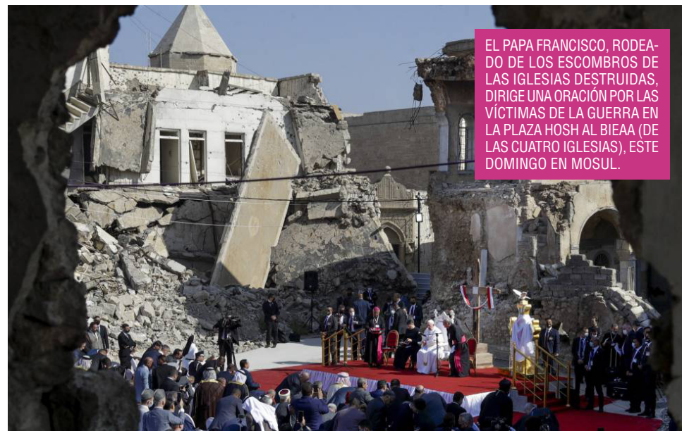
EL PAPA FRANCISCO, RODEADO DE LOS ESCOMBROS DE LAS IGLESIAS DESTRUIDAS, DIRIGE UNA ORACIÓN POR LAS VÍCTIMAS DE LA GUERRA EN LA PLAZA HOSH AL BIEAA (DE LAS CUATRO IGLESIAS), ESTE DOMINGO EN MOSUL.

20. Jesús no solo nos purifica de nuestros pecados, sino que nos hace partícipes de su misma fuerza y sabiduría. Nos libera de un modo de entender la fe, la familia, la comunidad que divide, que contrapone, que excluye, para que podamos construir una Iglesia y una sociedad abiertas a todos y solícitas hacia nuestros hermanos y hermanas más necesitados.