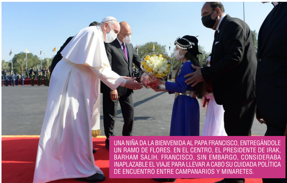
UNA NIÑA DA LA BIENVENIDA AL PAPA FRANCISCO, ENTREGÁNDOLE UN RAMO DE FLORES. EN EL CENTRO, EL PRESIDENTE DE IRAK, BARHAM SALIH. FRANCISCO, SIN EMBARGO, CONSIDERABA INAPLAZABLE EL VIAJE PARA LLEVAR A CABO SU CUIDADA POLÍTICA DE ENCUENTRO ENTRE CAMPANARIOS Y MINARETES.