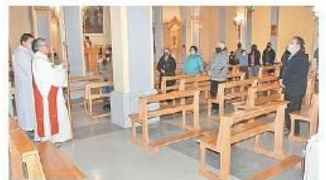
EN EL INTERIOR DEL TEMPLO DE MARÍA AUXILIADORA DEL CARMEN DE PUERTO NATALES SE REALIZÓ LA LITURGIA DE LA PASIÓN DEL SEÑOR.