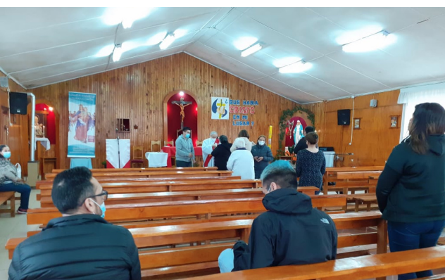
VIERNES SANTO EN LA CAPILLA SAN JUAN XXIII (LORENA MEDINA)