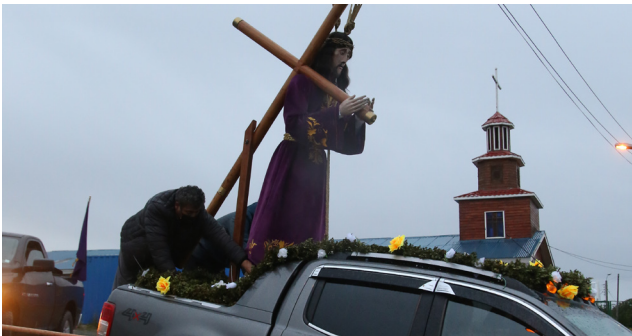
VIA CRUCIS DESDE JESÚS NAZARENO

abandonados y solos, a los que se encuentran sin trabajo y lo buscan desesperadamente. A las personas que viven en situación de calle. A los niños y jóvenes que se encuentran cansados y aburridos de no poder compartir su vida con sus compañeros y amigos. Reza-mos por todos nosotros, en que este tiempo de pandemia nos ha alterado nuestra vida y no nos ha permitido abrazar y acariciar a nuestros mayores y amigos. Que todos encontremos en la prueba de la Cruz la fuerza de la esperanza de la resurrección y del amor de Dios” (Padre Obispo Bernardo).