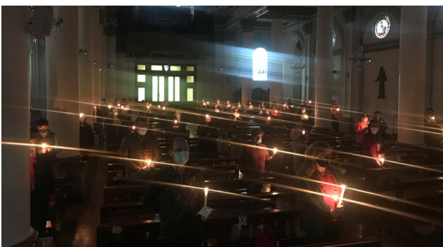
LITURGIA DE LA LUZ EN LA CATEDRAL

Celebramos en la fe, el acontecimiento central de nuestra vida cristiana: ¡Cristo ha resucitado! en las vigili-as pascuales de distintas comunidades, agradecidos del Señor de poder reunirnos en comunidad.