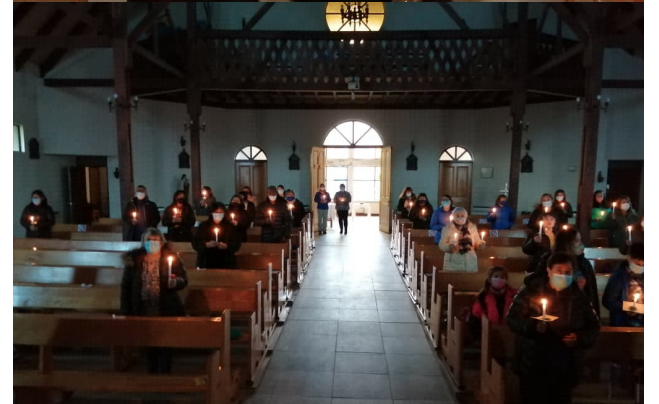
VIGILIA PASCUAL EN LA PARROQUIA SAN FRANCISCO DE SALES DE PORVENIR