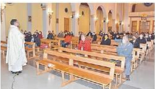
EL SÁBADO SANTO SE CELEBRÓ LA VIGILIA PASCUAL EN LA PARROQUIA MARÍA AUXILIADORA DEL CARMEN DE PUERTO NATALES.