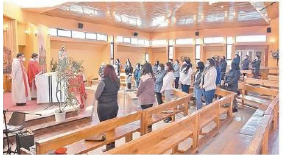
EN LA CAPILLA DON BOSCO DEL LICEO SALESIANO MONS. FAGNANO DE PUERTO NATALES SE CELEBRÓ LA EUCARISTÍA DE LA ÚLTIMA CENA.