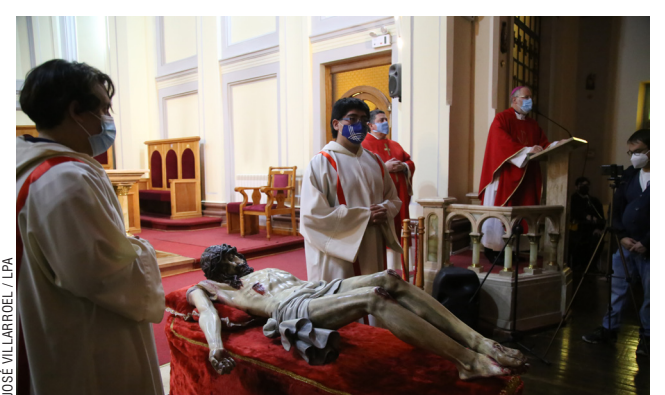
JOSE VILLARROEL / LPA