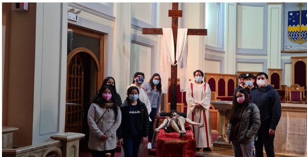
VIA CRUCIS ANIMADO POR LOS JÓVENES EN LA IGLESIA CATEDRAL