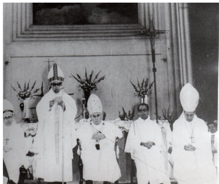
SALUDO EN EL DÍA DE SU ORDENACIÓN EPISCOPAL