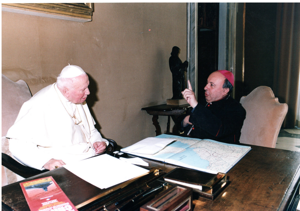
EN VISITA AD LIMINA EN ROMA CON JUAN PABLO II