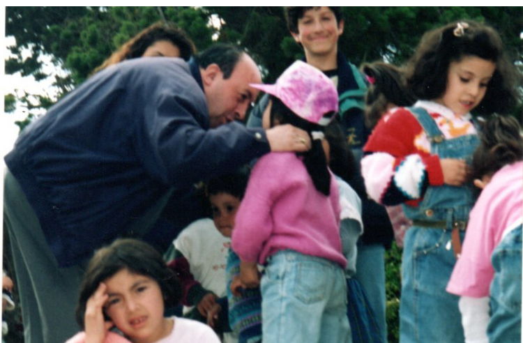
CON LOS NIÑOS DE LOS CEVAS EN LA PLAZA