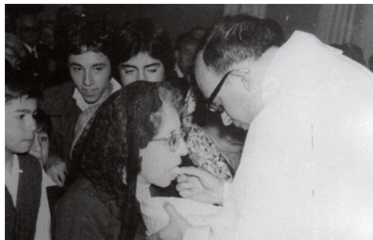
DANDO LA COMUNIÓN A SU MAMÁ EL DÍA DE SU ORDENACIÓN EPISCOPAL