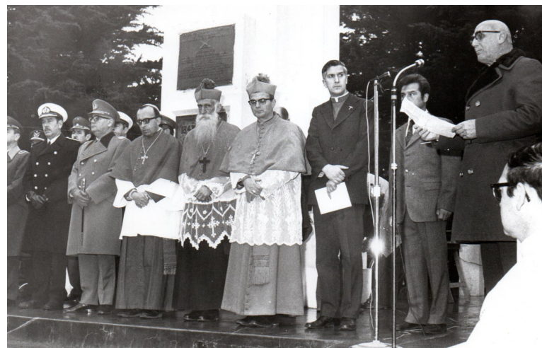
RECIBIMIENTO EN PUNTA ARENAS 1974