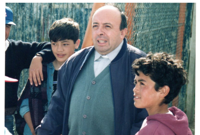
VISITANDO LOS CENTROS DE LOS CEVAS