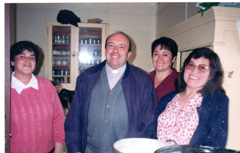
VISITA A LOS CEVAS CON LAS TÍAS DE LA COCINA