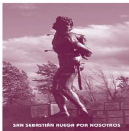
SAN SEBASTIÁN RUEGA POR NOSOTROS

13:00 / 17:00 / 20:30 horas: bendición de automóviles y conductores.