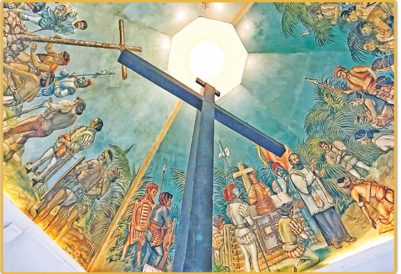
La Cruz de Magallanes, con la que el navegante llegó a Cebú, en Filipinas