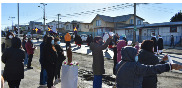
EL "SANTO PUEBLO DE DIOS", SALIÓ AL ENCUENTRO DE SU SEÑOR.