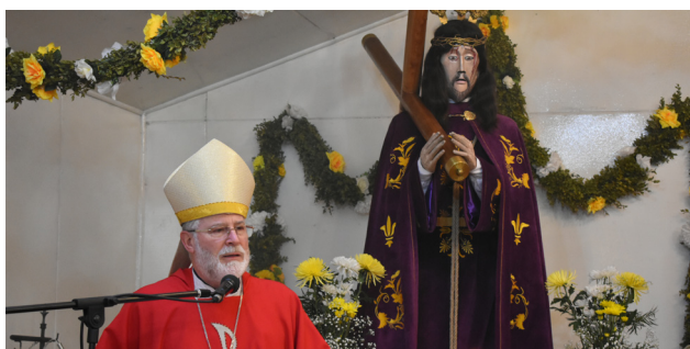
LAS PALABRAS Y PRESENCIA DEL PASTOR. GUÍA Y EMPUJE DEL PUEBLO CATÓLICO.