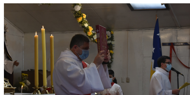
TU EVANGELIO Y EUCHARISTÍA, FUENTE Y CUMBRE DE NUESTRA VIDA CRISTIANA.