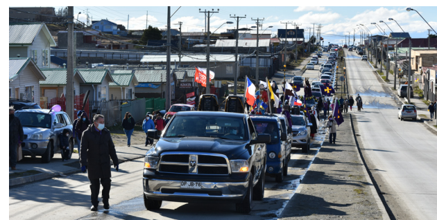
LA PROCESIÓN DEBÍO SER REEMPLAZADA POR CARAVANA. EL TESTIMONIO DE FE Y DEVOCIÓN SE MANTUVO INTEGRO.