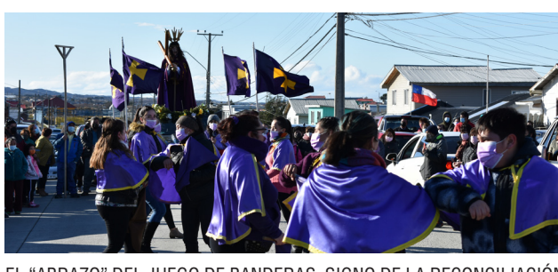
EL "ABRAZO" DEL JUEGO DE BANDERAS, SIGNO DE LA RECONCILIACIÓN DE LOS CINCO PUEBLOS Y DEL TRABAJO BIEN HECHO AL TERMINAR LA PROCESIÓN, DEBÍO CAMBIARSE POR UN "CODO A CODO".