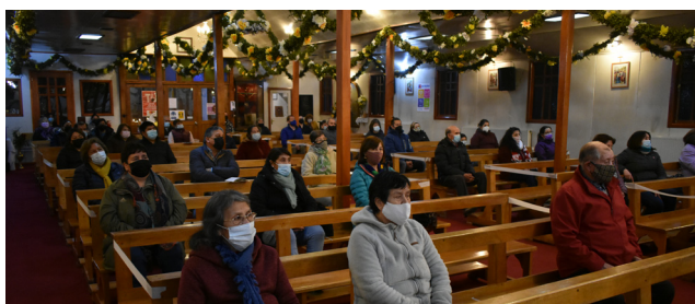
EL USO CONSTANTE DE MASCARILLAS Y LAS DISTANCIAS, ELEMENTOS "NOVEDOSOS" DE LA FESTIVIDAD.

Luego de diez jornadas de oración y devoción, compartimos algunas imágenes que destacan aspectos de la tradicional festividad en Honor a Jesús Nazareno.