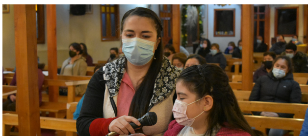
LA FE SE VIVE DESDE PEQUEÑOS.