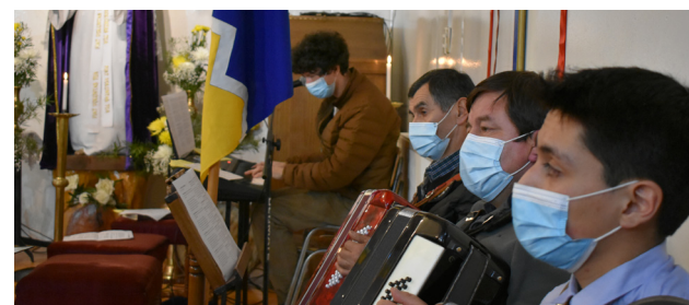
LA MÚSICA ANIMA Y AGLUTINA NUESTRA ORACIÓN.