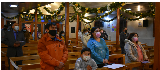
LA DEVOCIÓN NAZARENA, ES UNA DEVOCIÓN FAMILIAR.