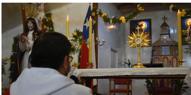
TU EVANGELIO Y EUCHARISTÍA, FUENTE Y CUMBRE DE NUESTRA VIDA CRISTIANA.