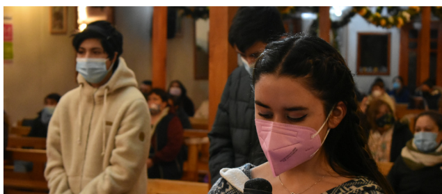
EL GRUPO DE CONFIRMACIÓN GUIÓ LA ORACIÓN LA OCTAVA NOCHE.