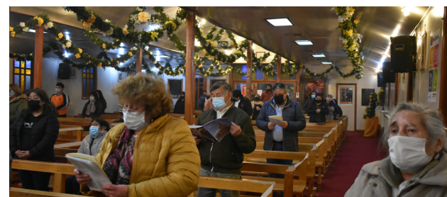
LAS ABUELAS Y ABUELOS, NUESTRO TESORO.