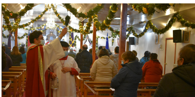
EN LA SEXTA NOCHE RENOVAMOS NUESTRAS PROMESAS BAPTISMALES.