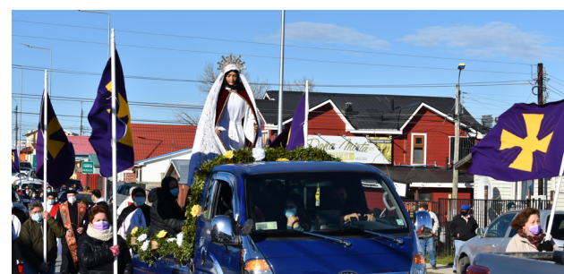
MARÍA, VIRGEN DOLOROSA. MODELO DE DISCÍPULA MISIONERA EN LOS TIEMPOS DIFÍCILES.