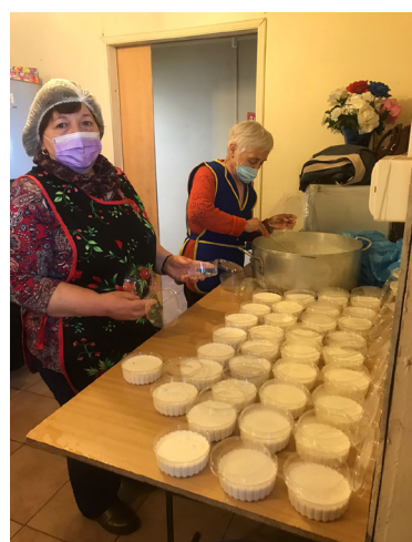
SANTA TERESA DE LOS ANDES