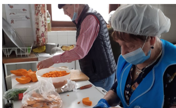
SANTUARIO MARIA AUXILIADORA