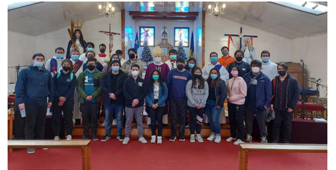
IMAGEN DE NUESTRA SEÑORA DE FÁTIMA PEREGRINA EN LA COMUNIDAD PARROQUIAL DE LA POBLACION 18 DE SEPTIEMBRE