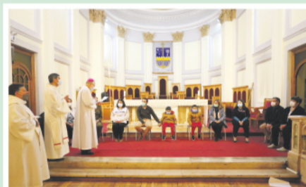
Una familia, una carabinera, una enfermera, un estudiante, una profesora, un matrimonio de coordinadores, una voluntaria de la casa del Samaritano