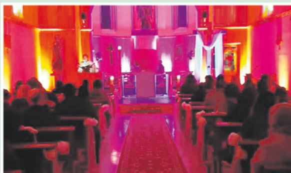
Vigilia Pascual en San Miguel