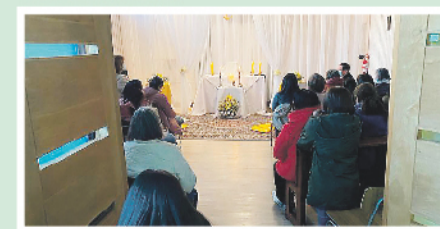
La Parroquia Santa Teresa de los Andes en vigilia de oración al inicio del inicio del triduo pascual