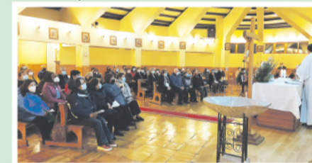
Reunidos en torno a la Eucaristía en Fátima