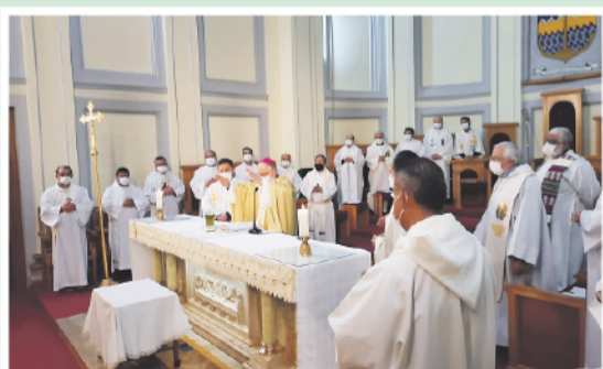
Bendición de los Óleos