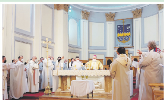
Renovación de Promesas y Bendición de los óleos para la celebración de los sacramentos