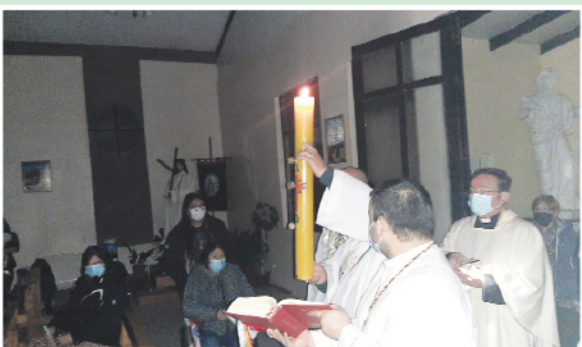
Proclamación de la Resurrección en Santa Teresa