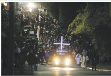
Vía Crucis por las calles de Punta Arenas