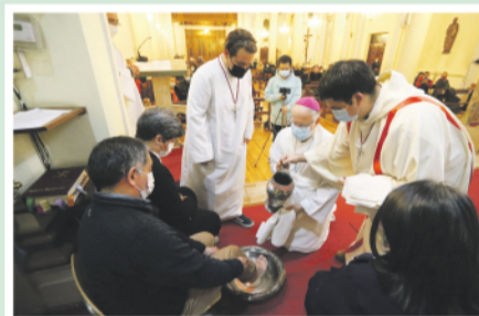
Coordinadores de la Comunidad al servicio de los demás