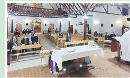
La comunidad fueguina celebra la institución de la Eucaristía