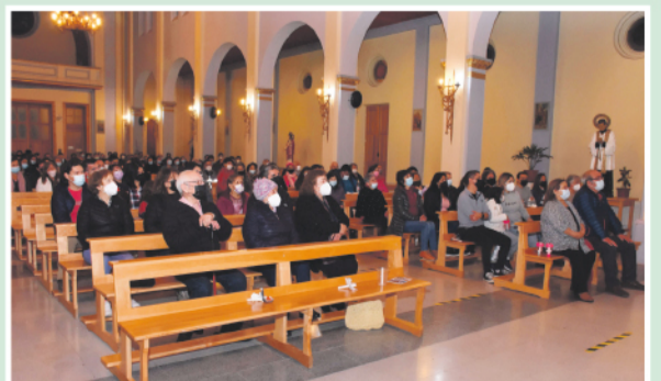
Vigilia Pascual en Puerto Natales