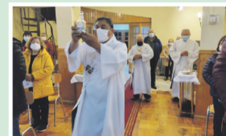
Presentación de los óleos en Fátima