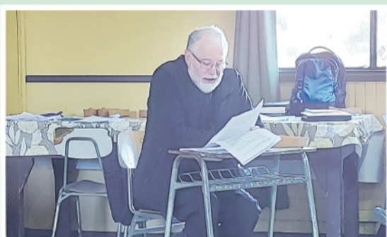
El Padre Obispo animó el retiro de preparación a la renovación de las promesas sacerdotales

Consagración de los santos óleos para la celebración de los sacramentos y Renovación de las promesas sacerdotales.