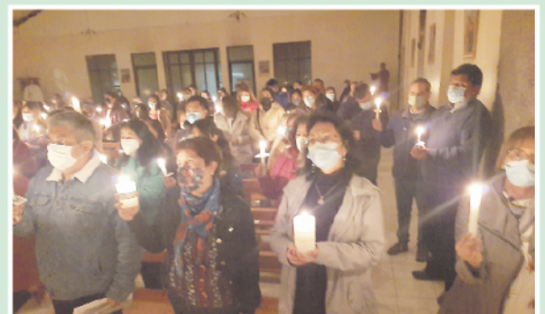
Vigilia Pascual en Santa Teresa