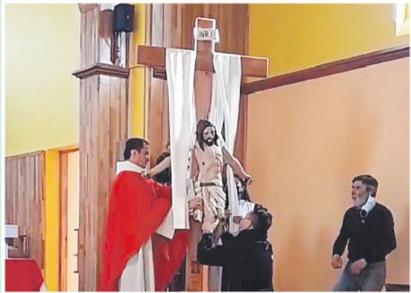
Liturgia del desclave en San Miguel

A través de la liturgia del desclave, las comunidades revivieron la entrega de Jesús que nos amó hasta el extremo. Al caer la tarde, todas las comunidades, tras dos años interrumpidos por la pandemia, hicieron el camino del Señor con las estaciones del Vía Crucis por la paz.