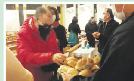
Pan compartido en Cristo Obrero