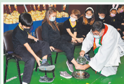
Lavatorio de los pies en Puerto Natales