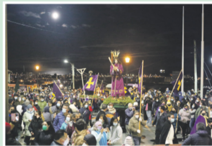
El Nazareno en medio de su pueblo