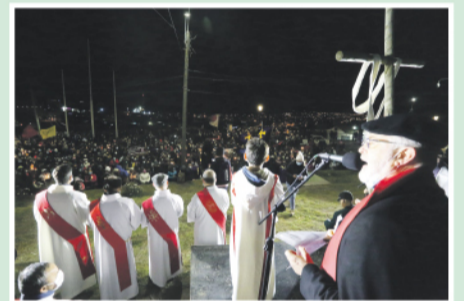
El mensaje del Pastor en el Vía Crucis por la paz