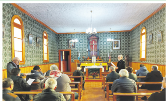
Oración y reflexión en la casa de retiro de Leñadura