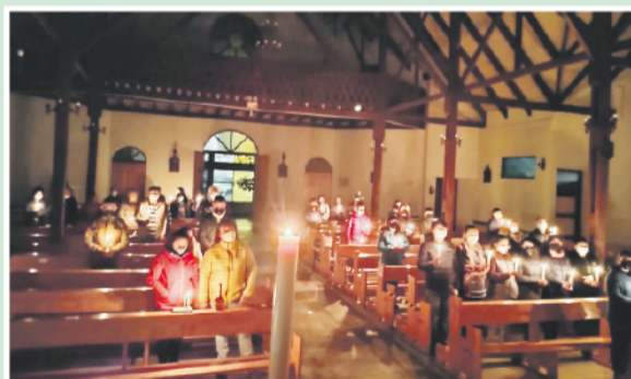
Vigilia Pascual en Porvenir