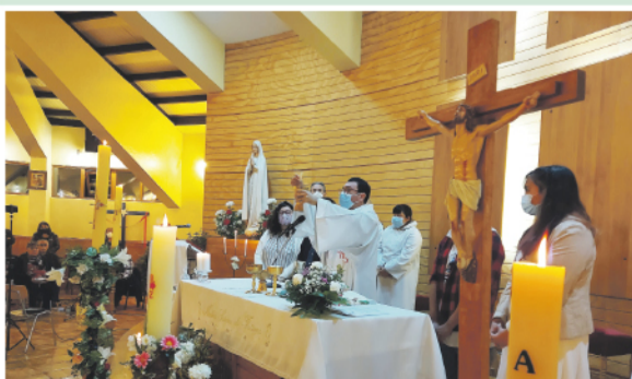
Vigilia Pascual en la Parroquia de Fátima