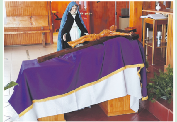
Adoración a la cruz en San Juan XXIII