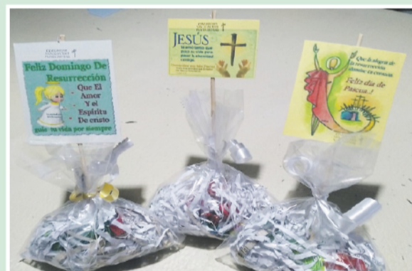
Mensaje de resurrección Comunidad San Juan XXIII

Rica de signos, la vigilia pascual fue preparada con esmero en las distintas comunidades.