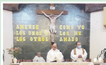
Hagan esto en Memoria Mia... Cristo Obrero haciendo memoria