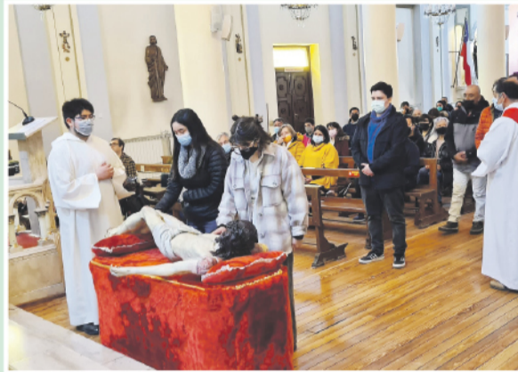
Adoramos a aquel que nos amó hasta el extremo en Catedral