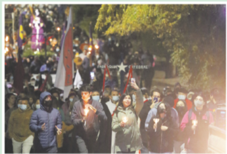
Jóvenes dando testimonio público de su fe