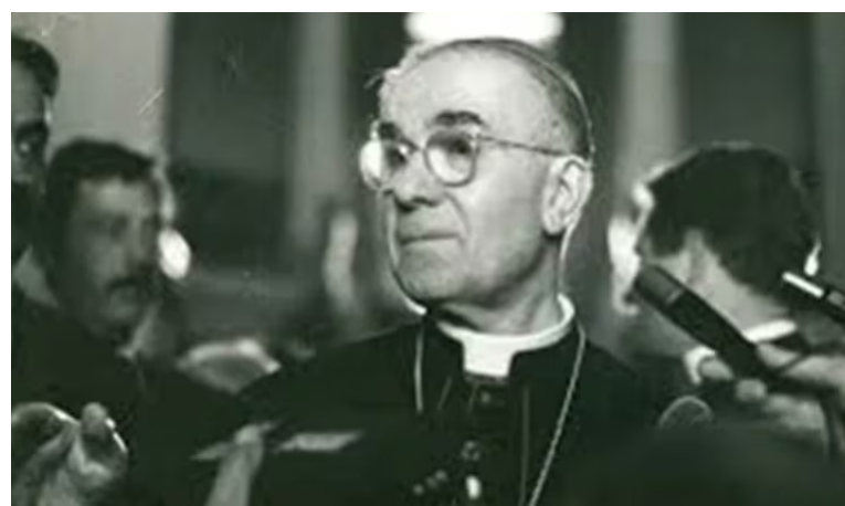
EL CARDENAL ANTONIO SAMORÉ MURIÓ EN ROMA, A LOS 78, SIN SABER QUE HABÍA CONSEGUIDO FRENAR LA GUERRA ENTRE ARGENTINA Y CHILE.

El cardenal Antonio Samoré no pudo ver el resultado final de su trabajo, murió en Roma el 3 de febrero de 1983, a los 78 años.