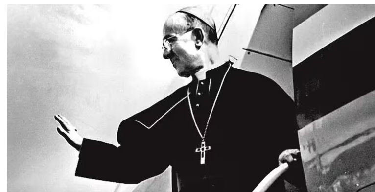
“ALCANZO A DIVISAR UNA LUZ DE ESPERANZA AL FINAL DEL TÚNEL”, DIJO EL CARDENAL ANTONIO SAMORÉ, EL ENVIADO DE JUAN PABLO II CUANDO LLEGÓ A BUENOS AIRES CINCO DÍAS DESPUÉS DEL LLAMADO A LA PAZ.

El cardenal Antonio Samoré, un hábil diplomático de 73 años, llegó a Buenos Aires el 27 de diciembre de 1978, cinco días después del llamamiento papal. “Alcanzo a divisar una luz de esperanza al final del túnel”, dijo después de mantener las