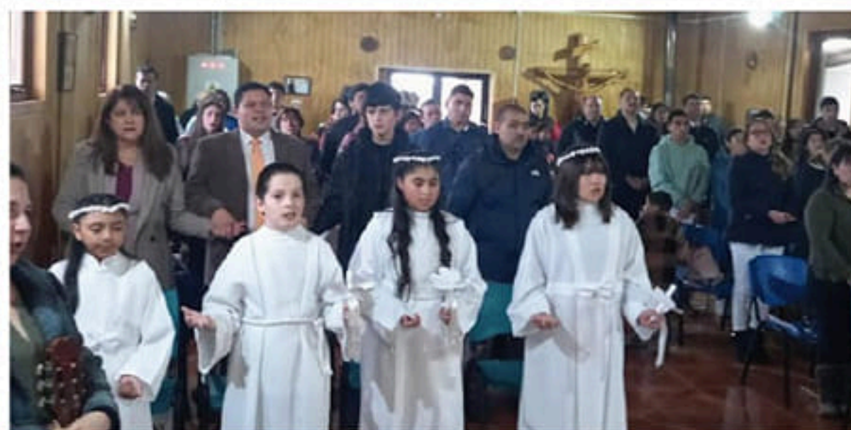
LOS NIÑOS EN PUERTO WILLIAMS CELEBRARON SU PRIMERA COMUNIÓN Y, DOS DE ELLOS, SU BAUTISMO.