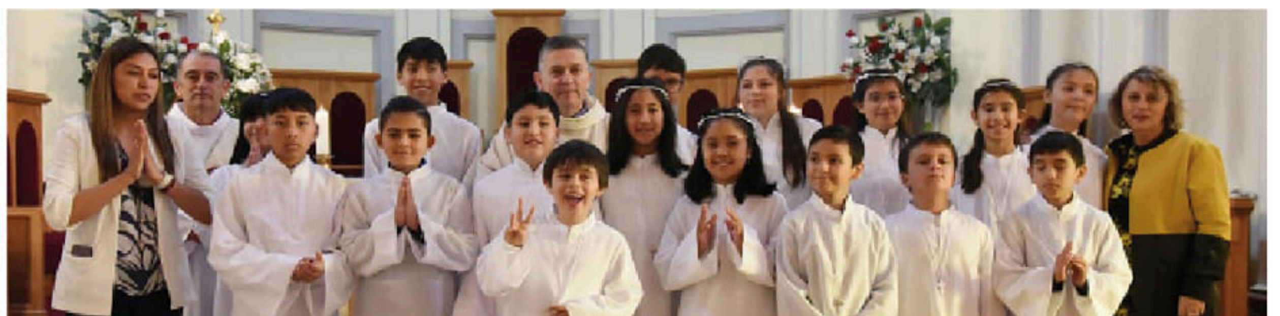
16 NIÑOS CELEBRARON SU PRIMERA COMUNIÓN EN LA COMUNIDAD PARROQUIAL DE LA CATEDRAL.