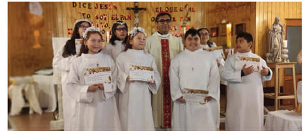
LA COMUNIDAD BIEN PASTOR DE PUERTO NATALES CELEBRÓ LAS PRIMERAS COMUNIONES JUNTO AL PASTOR DIOCESANO.