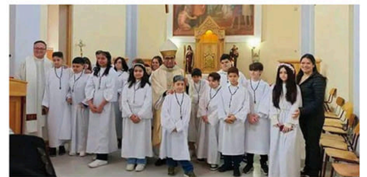
EL P. OBISPO PRESIDÓ LAS PRIMERAS COMUNIONES DE NIÑOS Y ADULTOS EN LA PARROQUIA MARÍA AUXILIADORA DE PUERTO NATALES.