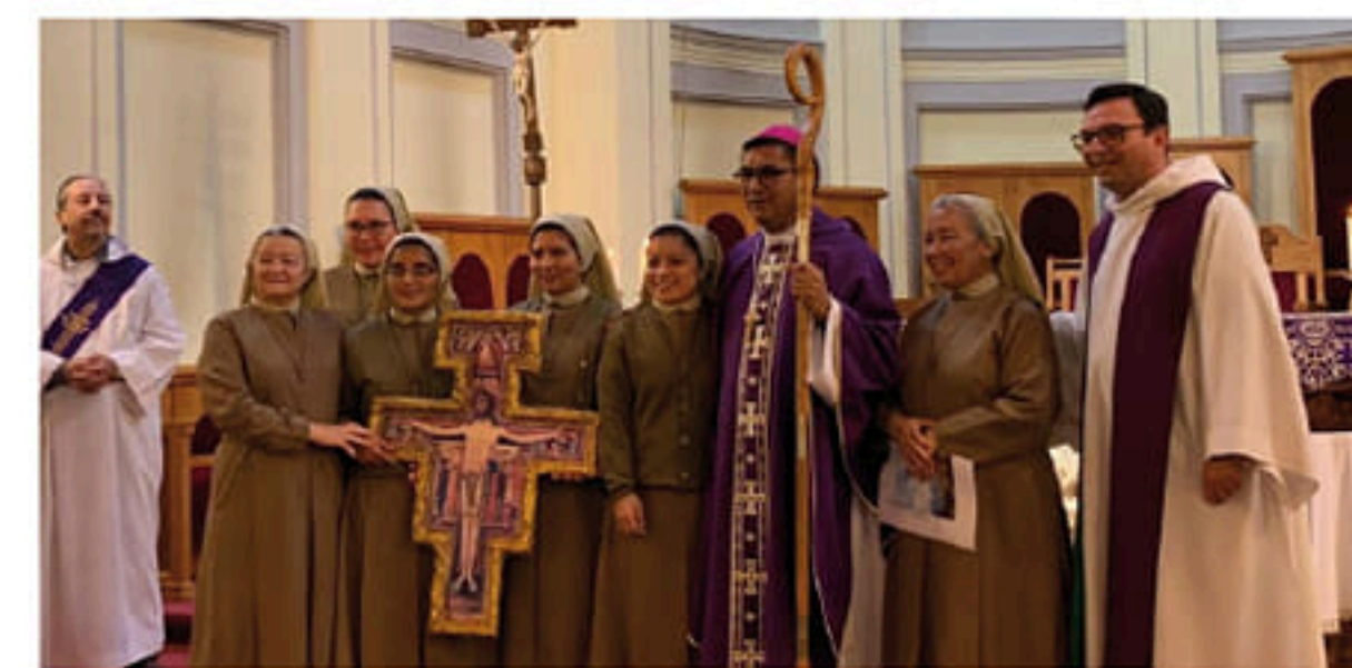
LAS HERMANAS FUNDADORAS JUNTO A MIEMBROS DEL CONSEJO GENERAL DEL INSTITUTO RELIGIOSO.