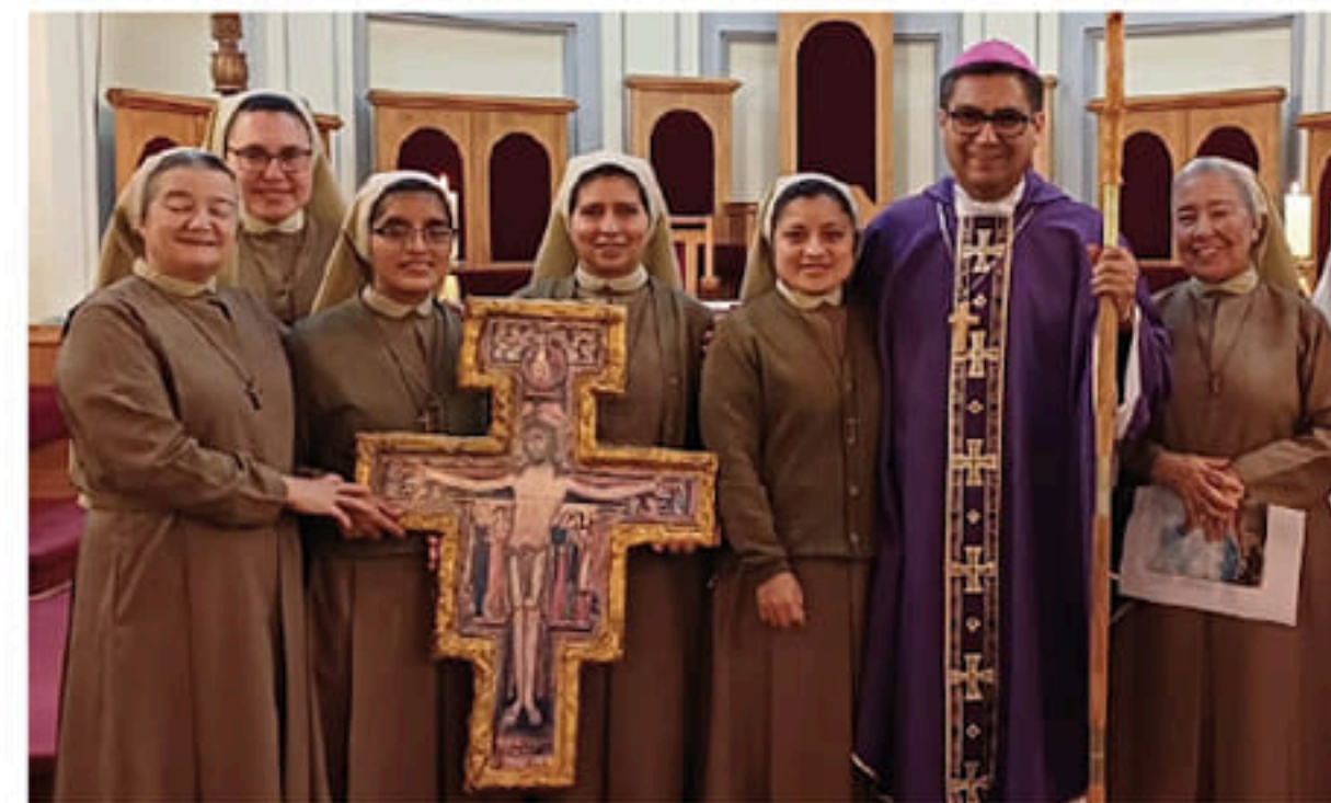
LA COMUNIDAD RELIGIOSA JUNTO AL PASTOR DIOCESANO.