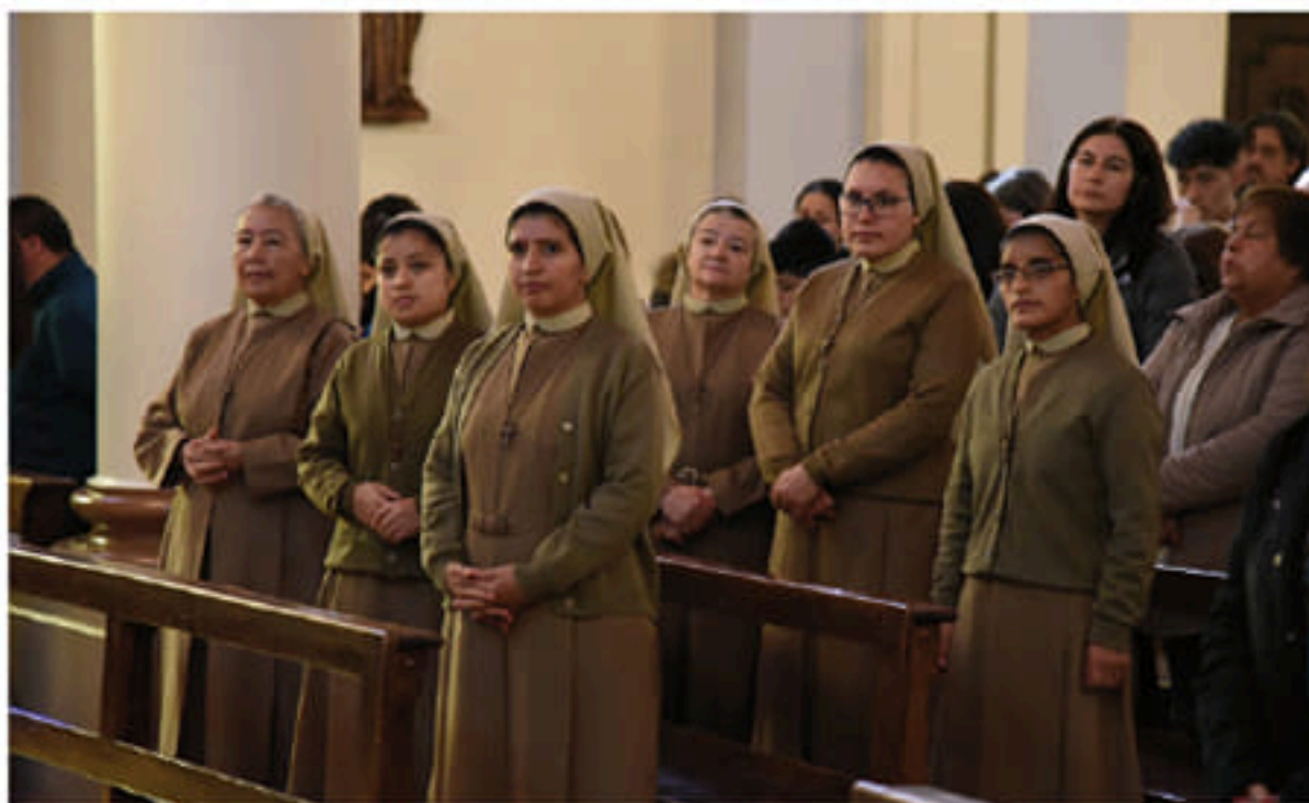
LAS HERMANAS SIERVAS MISIONERAS DEL DIVINO ESPÍRITU EN LA EUCARISTÍA DE LA CATEDRAL: "NOS HEMOS SENTIDOS MUY ACOGIDAS", MANIFESTARON.