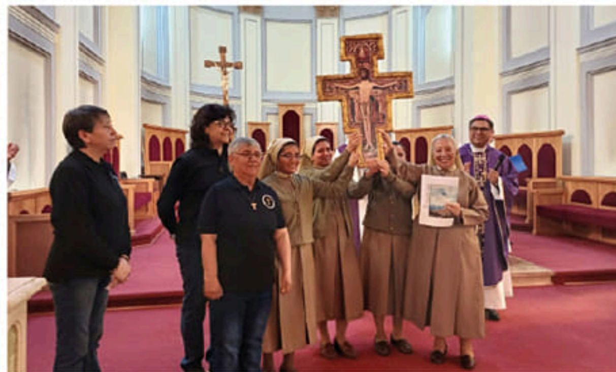
LAS HERMANAS FUNDADORAS DE LA COMUNIDAD DE PUNTA ARENAS JUNTO A LA SUPERIORA GENERAL, RECIBEN EL CRISTO DE SAN FRANCISCO DE ASÍS: ¡RESTAURA MI IGLESIA!