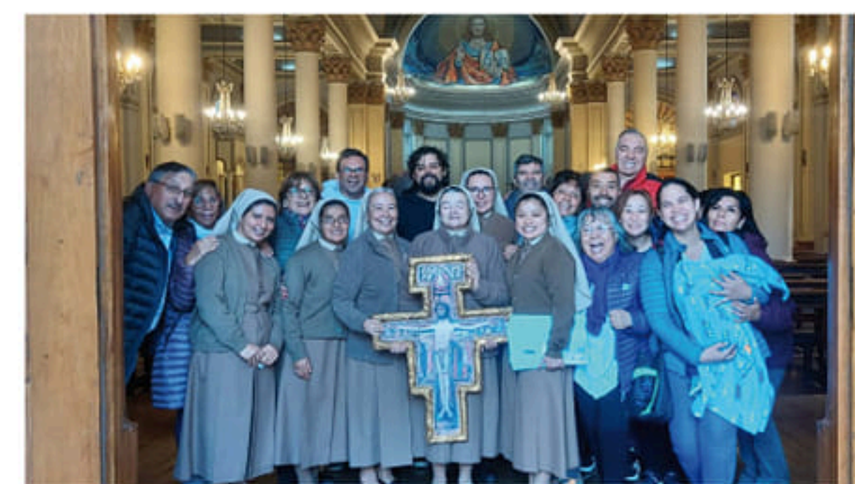
UN GRUPO DE LA RENOVACIÓN CARISMÁTICA QUE ACOGE A LA NUEVA COMUNIDAD RELIGIOSA.