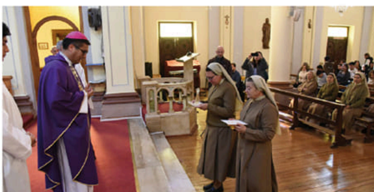
LAS RELIGIOSAS PARTICIPARON ACTIVAMENTE EN LA CELEBRACIÓN DE LA EUCARISTÍA EN LA QUE INICIARON SU MISIÓN PASTORAL EN LA IGLESIA MAGALLÁNICA.