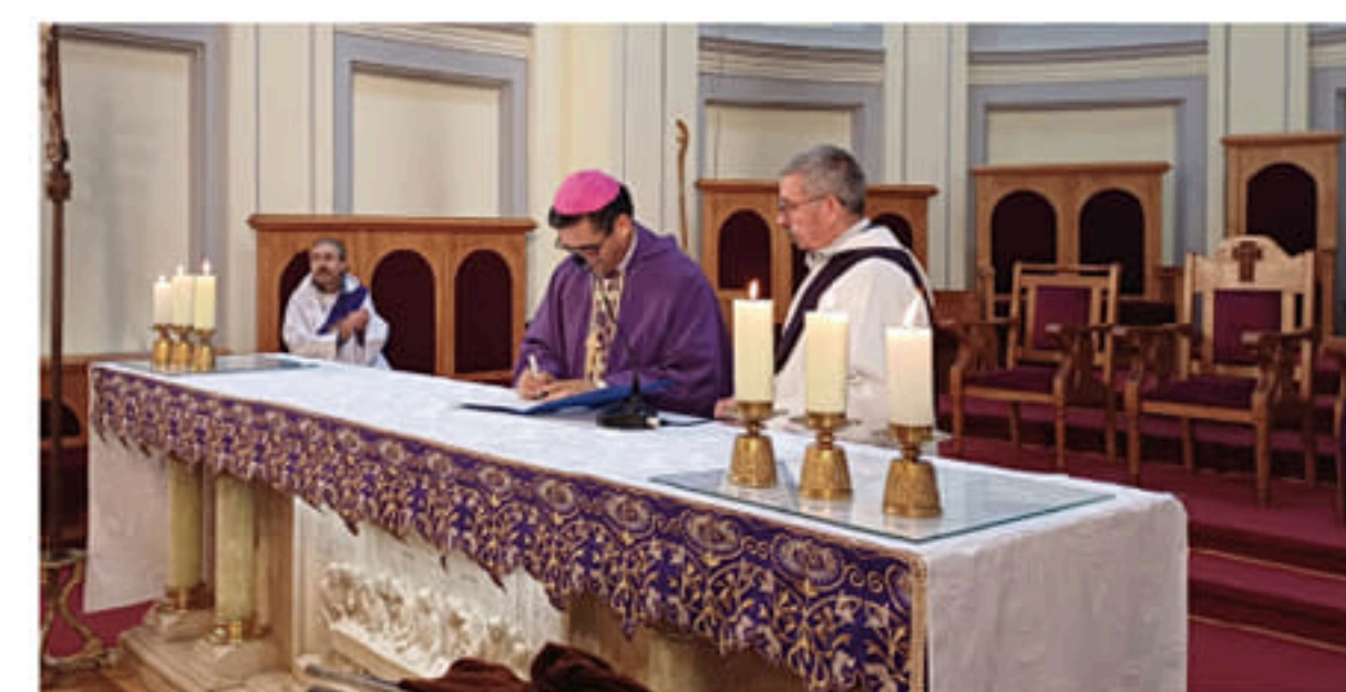
EL OBISPO FIRMA EL DECRETO DE FUNDACIÓN DE LA COMUNIDAD DE LAS HERMANAS SIERVAS MISIONERAS DEL DIVINO ESPÍRITU EN LA DIÓCESIS DE PUNTA ARENAS.