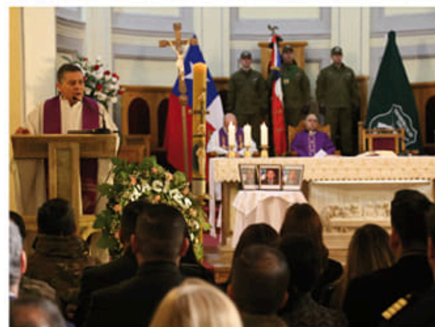
EN LA CATEDRAL SE CELEBRÓ LA EUCARISTÍA CON LA PRESENCIA DE TODAS LAS AUTORIDADES REGIONALES Y CON GRAN CANTIDAD DE PERSONAS QUE SE UNIERON EN LA ORACIÓN POR LOS CARABINEROS.