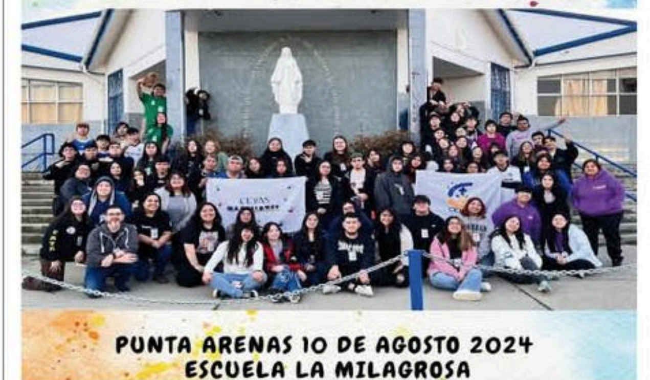
PUNTA ARENAS 10 DE AGOSTO 2024 ESCUELA LA MILAGROSA