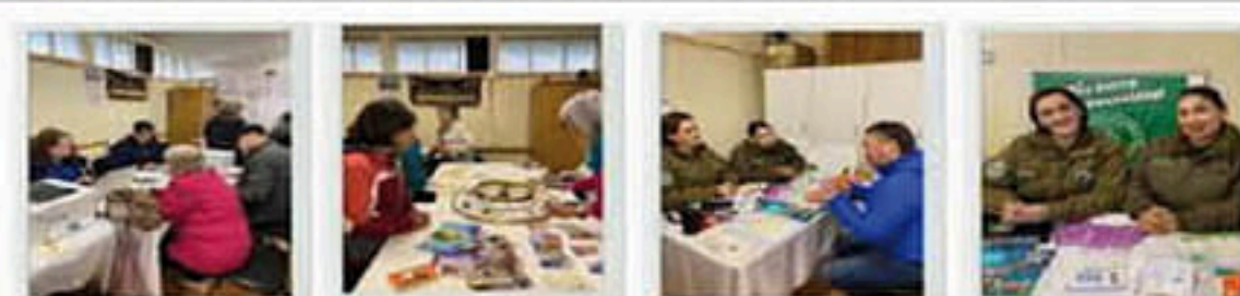
Comunidad Dios Padre