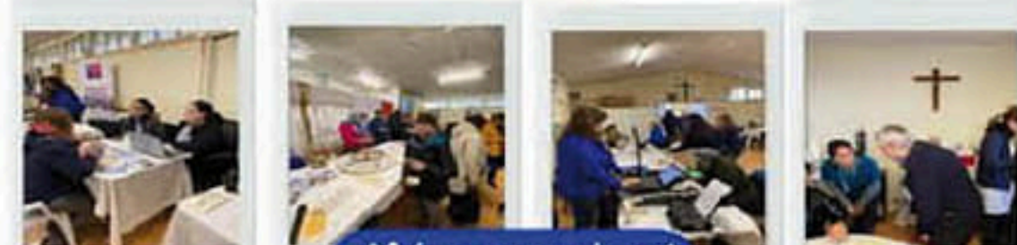
¡Más cerca de ti!