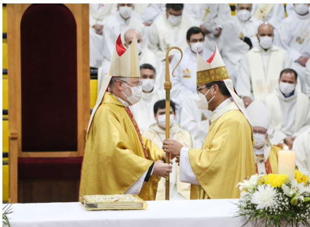
LA ENTREGA DE LA MISIÓN PASTORAL

manera esplendorosa. Además, todavía se vive con cierta tranquilidad. Puedes dejar el auto estacionado en la calle y probablemente no pase nada. Pero también es un gran desafío. Es una zona extrema, donde se siente la distancia y el aislamiento. Salir de Punta Arenas cuesta dinero. Aquí no es tan fácil decir “mañana voy a otra ciudad”. Hay que tomar avión y eso tiene un costo importante. También he sentido mucho el centralismo. Las decisiones se toman en Santiago y a las regiones les cuesta avanzar. Pero aquí veo algo muy bonito: hay capacidad de diálogo entre las autoridades. Aunque sean de sectores distintos, se reúnen, conversan y trabajan juntos. Eso me llama la atención y lo valoro mucho. Y en la Iglesia también hay mucha fe, mucha religiosidad popular. La presencia chilota ha aportado enormemente a la cultura religiosa y a la piedad popular de Magallanes.