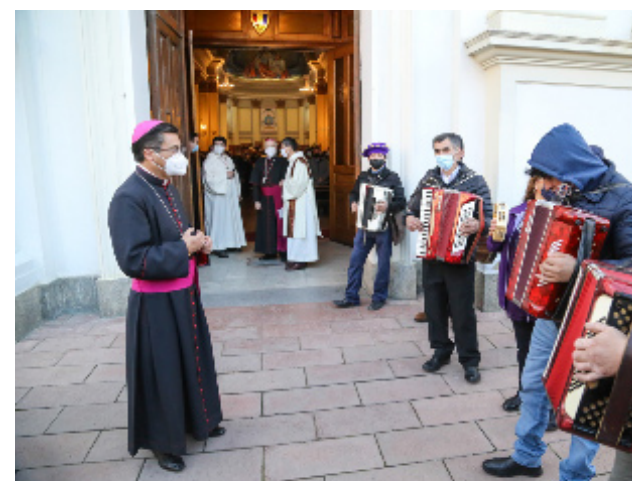
INICIO DEL CAMINO AL RITMO DE PASACALLES

Vivir en Magallanes es un privilegio. Es una región muy particular, con una belleza impresionante. La obra de Dios aquí se manifiesta de