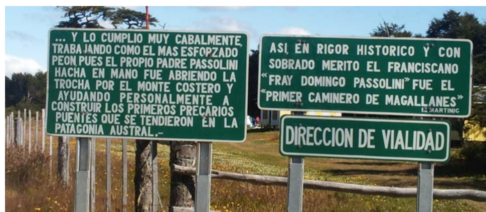
Señalética en el camino que conduce al faro San Isidro