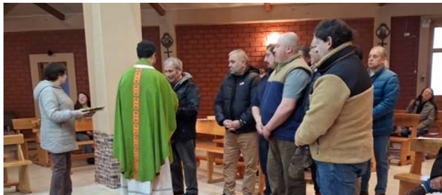
SANTUARIO JESUS NAZARENO DE PORVENIR.

En todas las comunidades cristianas, durante la liturgia dominical, se dio gracias al Señor por los papás en la celebración de su día, recordando también a todos aquellos que han fallecido y viven en Cristo. En muchas comunidades se preparó un recuerdo especial para los papás que participaron de la celebración dominical.