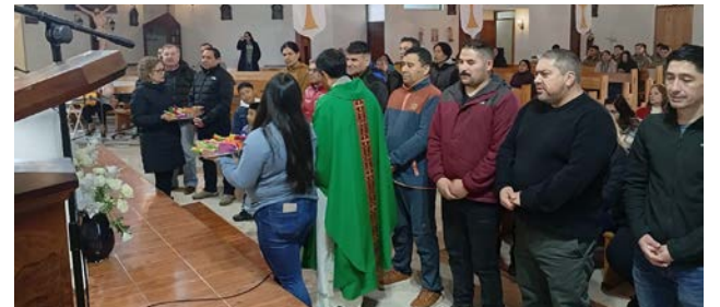
PARROQUIA SAN FRANCISCO DE SALES.