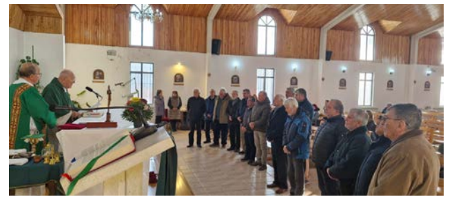
COMUNIDAD DIOS PADRE.