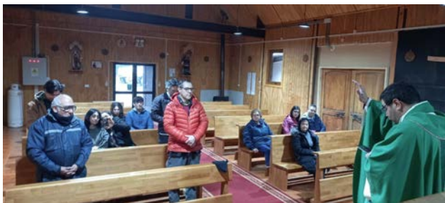
PARROQUIA DE PUERTO WILLIAMS.